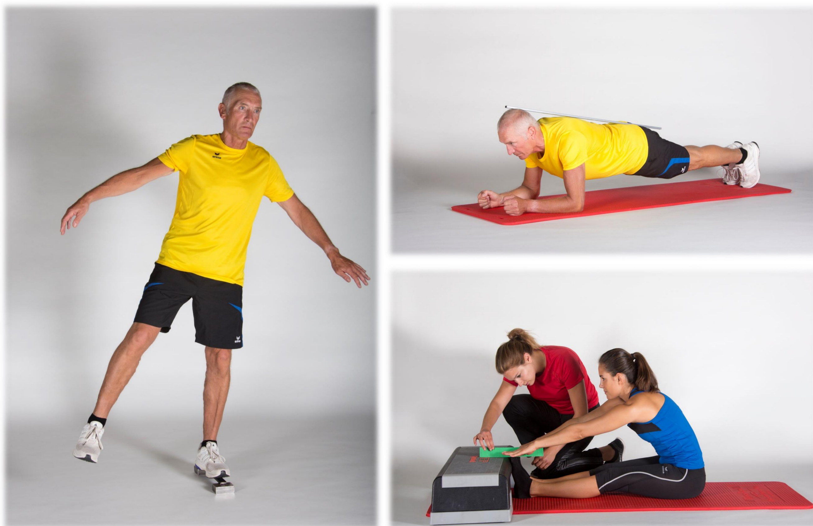
Abb. 1: Beispielübungen des Fitness Abzeichens

Ein gesundheitsorientierter Fitnesstest wird mit überdurchschnittlichem Ergebnis absolviert.