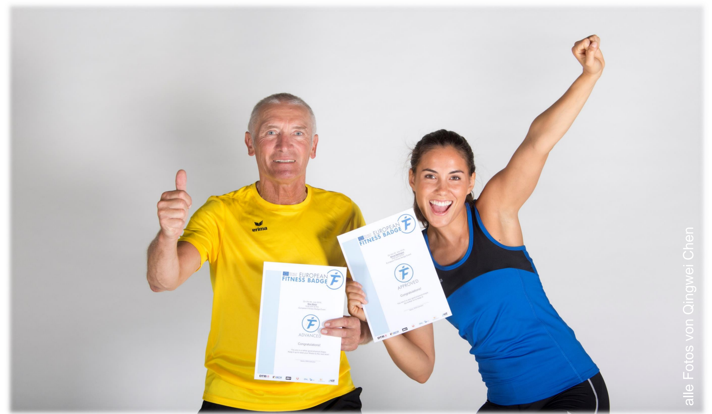
Abb. 3: Catch the Badge!

Die Testauswertung erfolgt mit Hilfe einer eigens entwickelten Software und Datenbank.